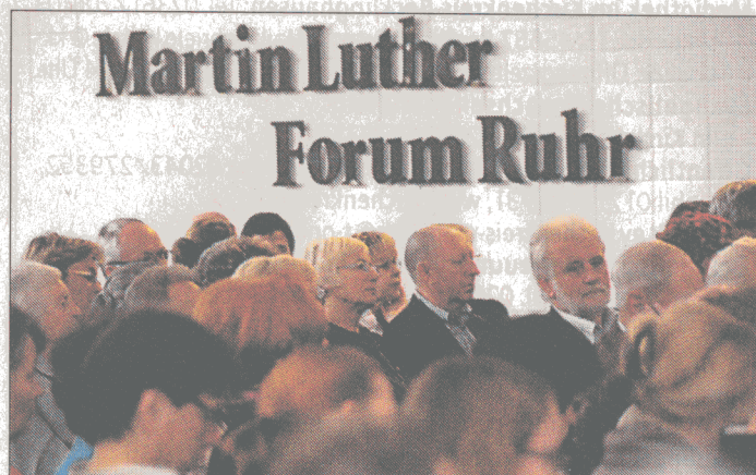
Mit dem Thema „Reformation und Musik“ setzt das MLFR in seinem neuen Programm einen thematischen Schwerpunkt.