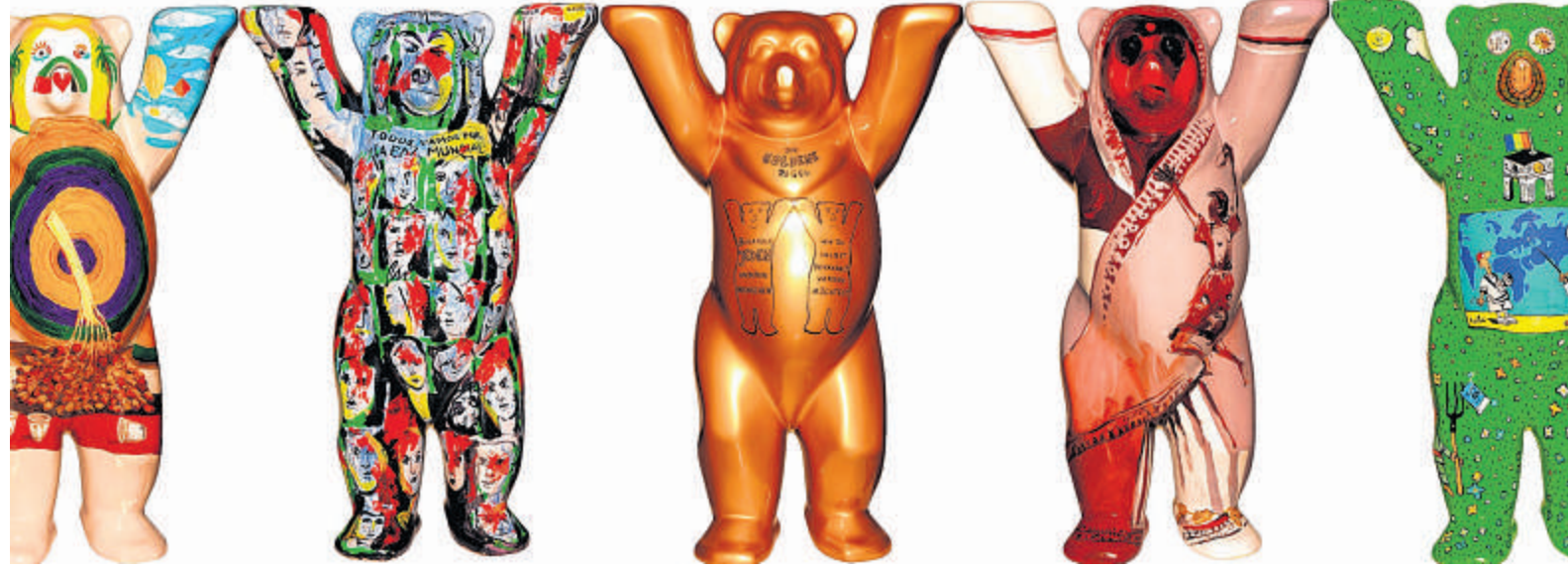
Jeder Buddy Bear erhielt in „seinem“ Land eine eigene, typische Gestaltung. So wird die Gruppe zum Sinnbild der Vielfalt der Nationen.

Die Bären, ursprünglich als Kunstprojekt in (natürlich) Berlin „geboren“, sind ja nicht nur nett und knuddelig anzusehen. In ihnen steckt viel mehr, als auf den ersten Blick erkennbar ist. Zunächst einmal verkörpert jeder Einzelne in der Gruppe ein Mitgliedsland der Vereinten Nationen. Auf ihrer Welttournee kommen von Land zu Land neue Kumpel hinzu, so dass der