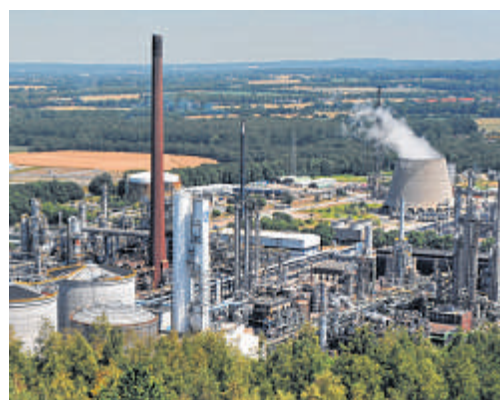
Die Raffinerie in Scholven steht wegen teils erhöhter Benzolwerte in der Kritik.