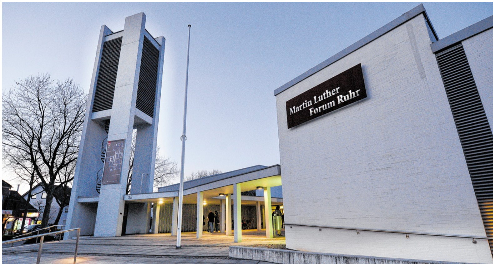
Zum Zentrum für Dialog und Diskussion hat sich das Martin Luther Forum Ruhr an der Bülser Straße entwickelt.